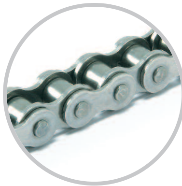
Cadena de acero inoxidable