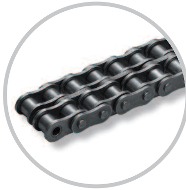
Cadena de tramos múltiples