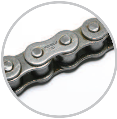
Cadena de transmisión